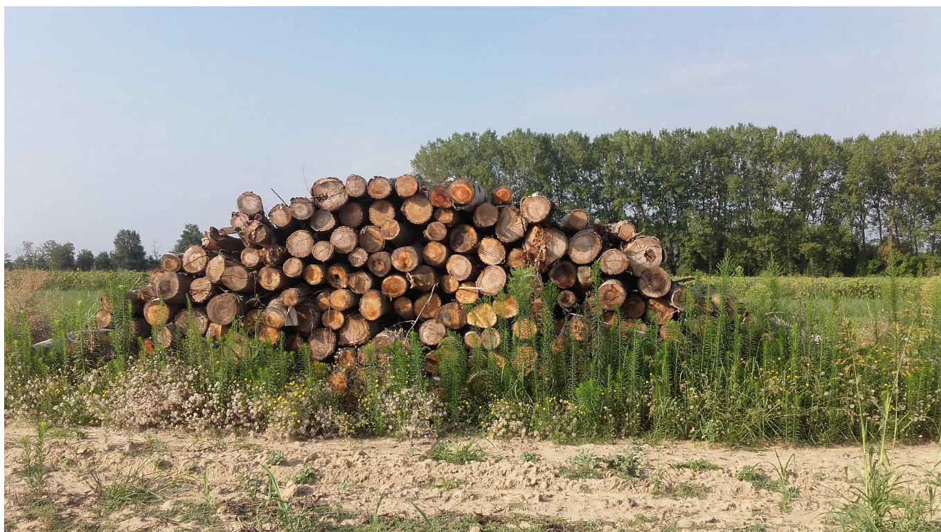
Foto catasta 2