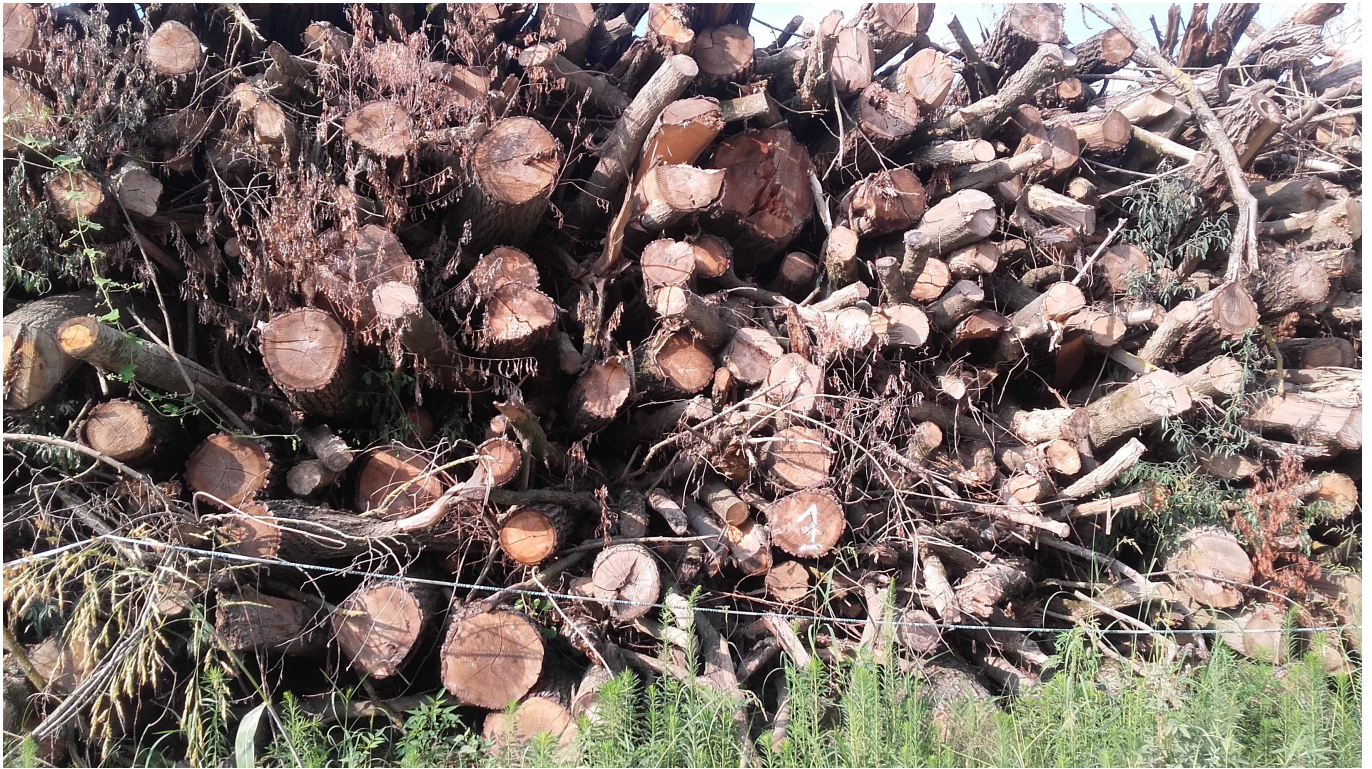
Foto catasta 1