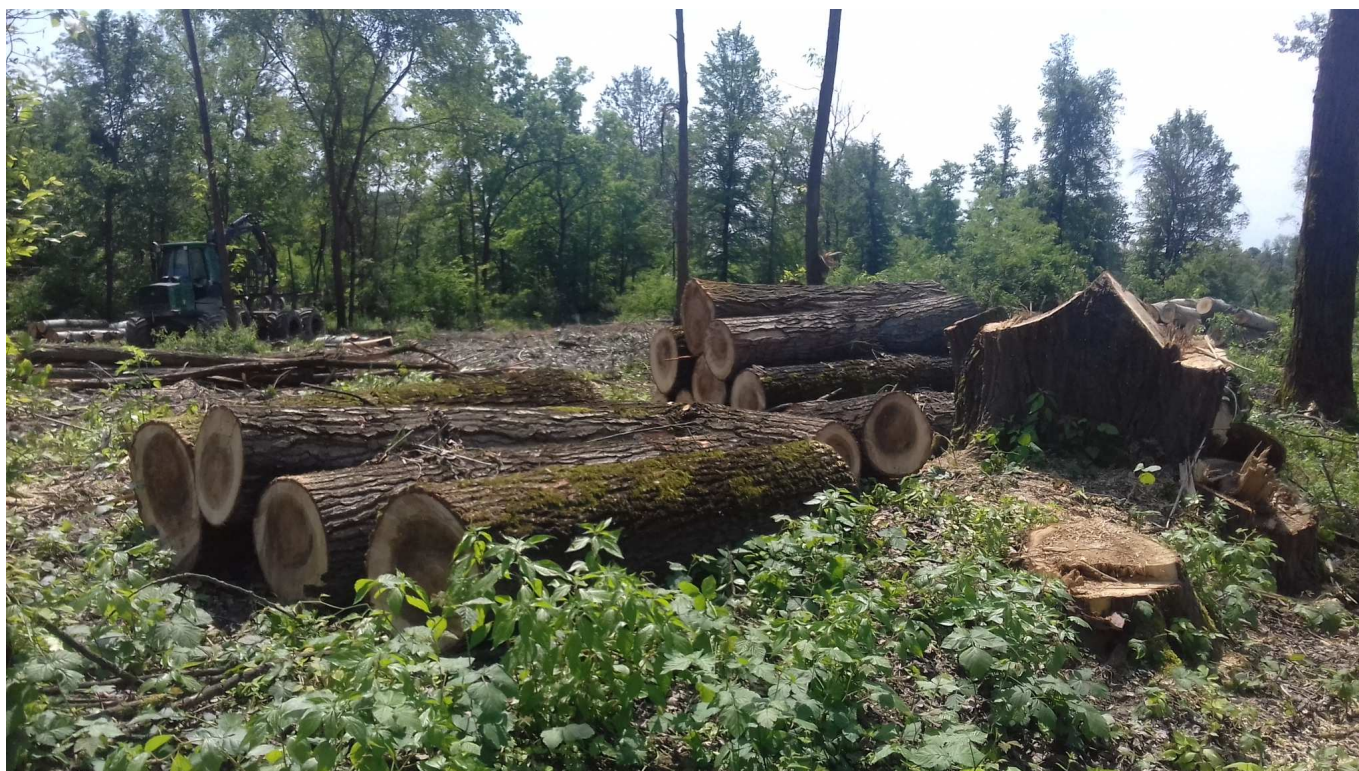
Foto cataste sparse