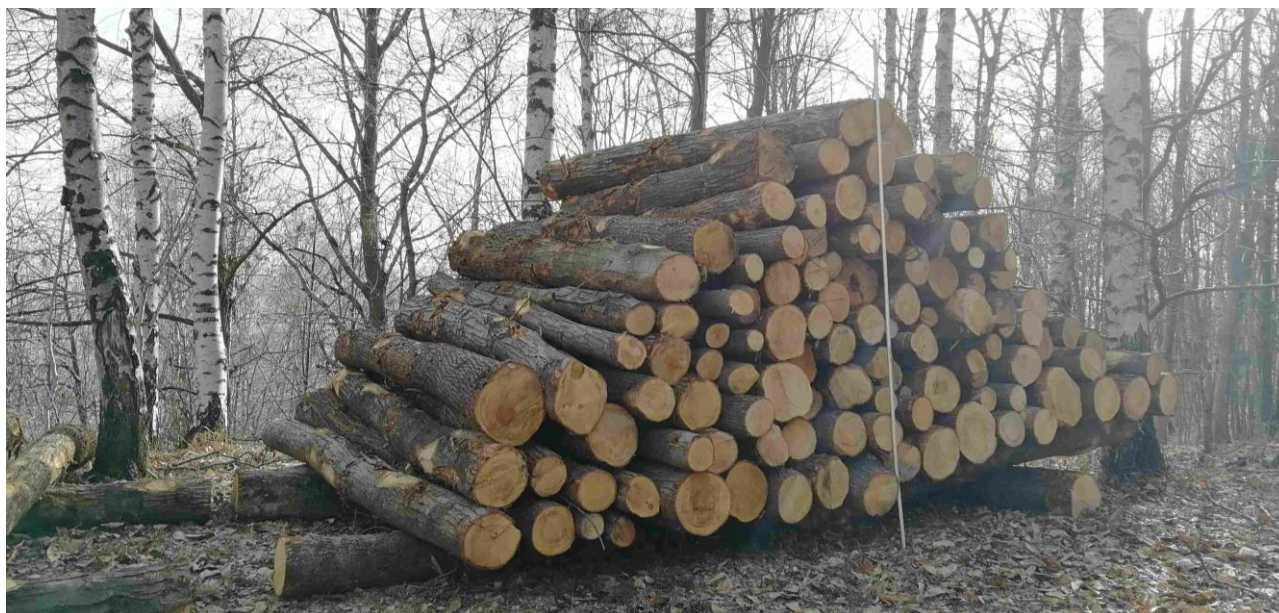
Lotto 1 – Castagno da paleria (pali da 3 m) – l'asta fotografata misura 3 m