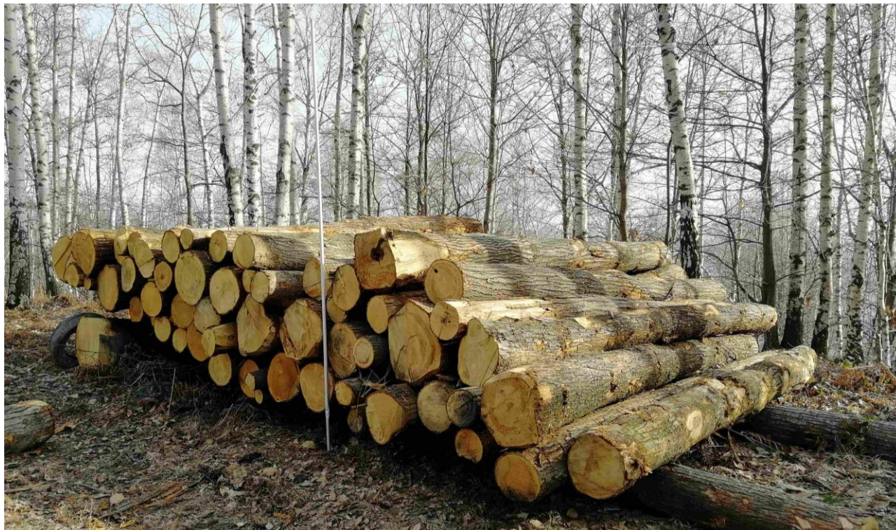
Lotto 1 – Castagno da paleria (pali da 4 m) – l'asta fotografata misura 3 m