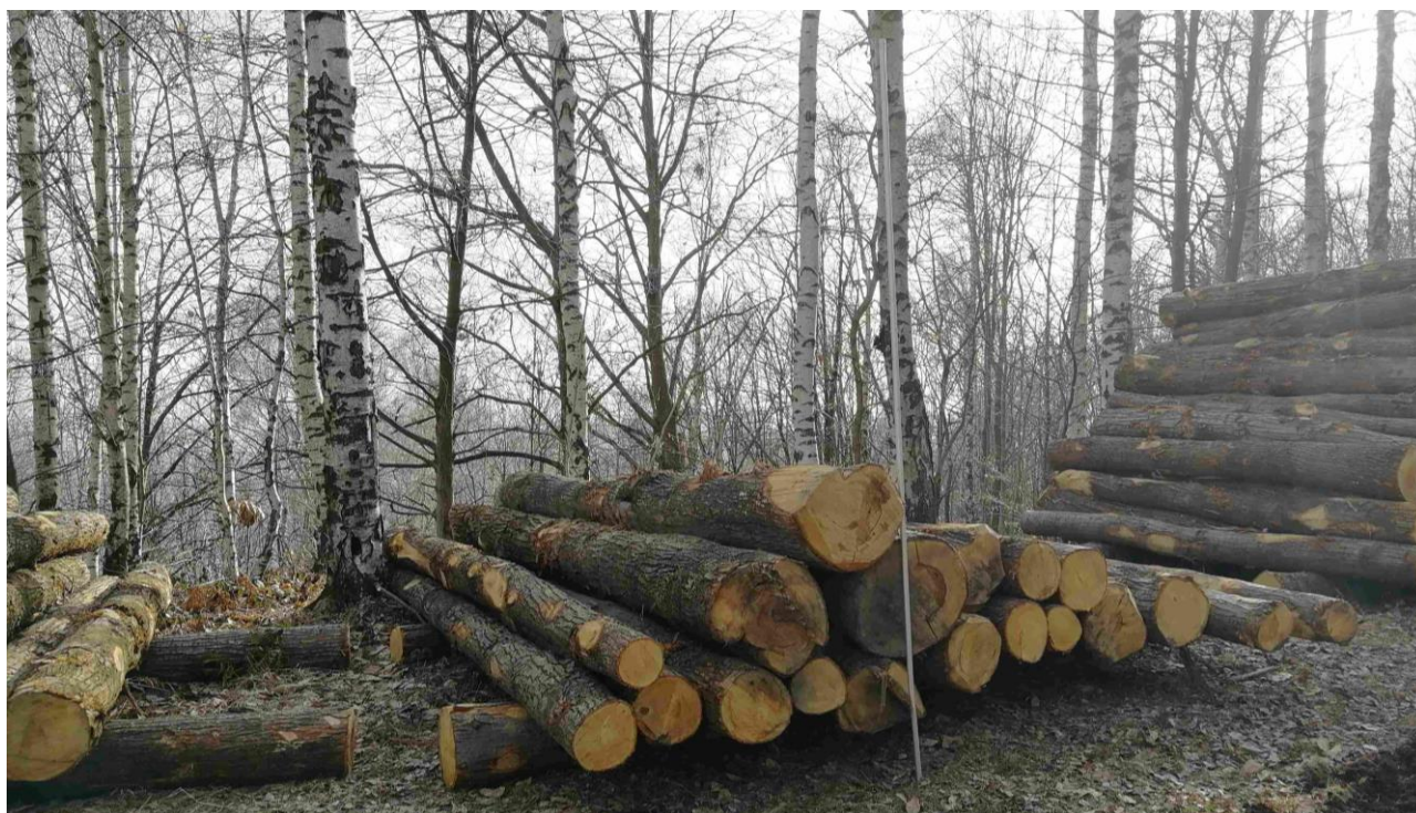
Lotto 1 – Castagno da paleria (pali da 5 m) – l'asta fotografata misura 3 m