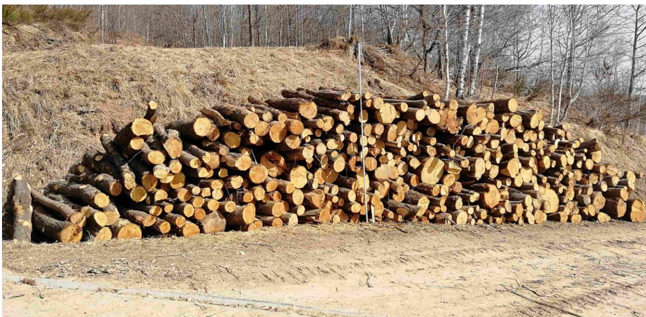
Lotto 2 – Legna da ardere di castagno – l'asta fotografata misura 3 m