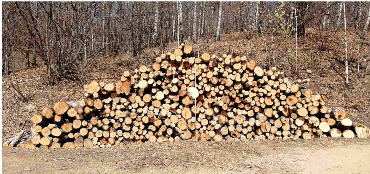
Lotto 3 – Legna da ardere di betulla – l'asta fotografata misura 3 m