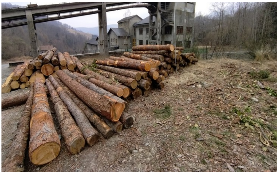
Lotto 10 – Castagno e larice da paleria (larice) – l'asta misura 3 m