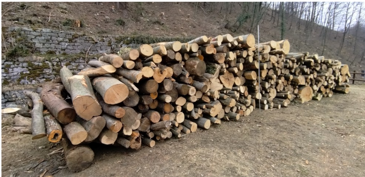
Lotto 11– Latifoglie da ardere (catasta A1 – piazzale) – l'asta misura 3 m