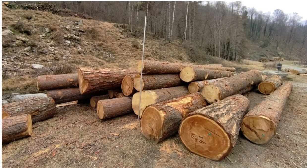
Lotto 7 – Larice e abete rosso da opera – l'asta misura 3 m