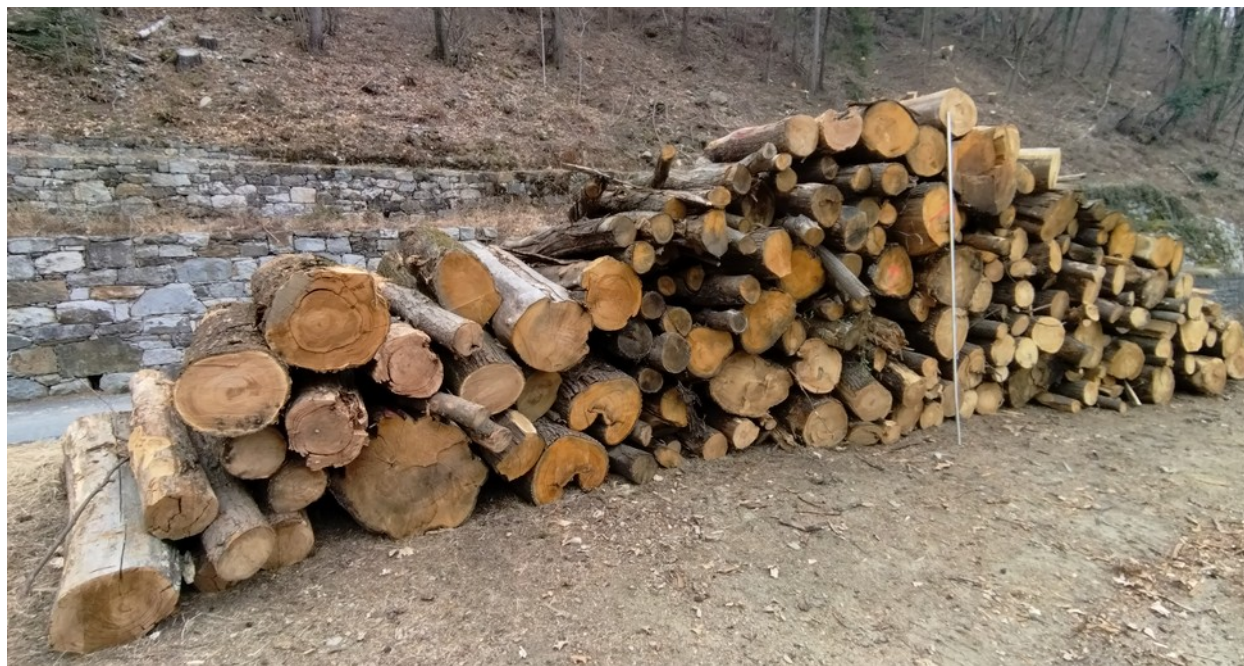
Lotto 13 – Castagno da ardere – l'asta misura 3 m