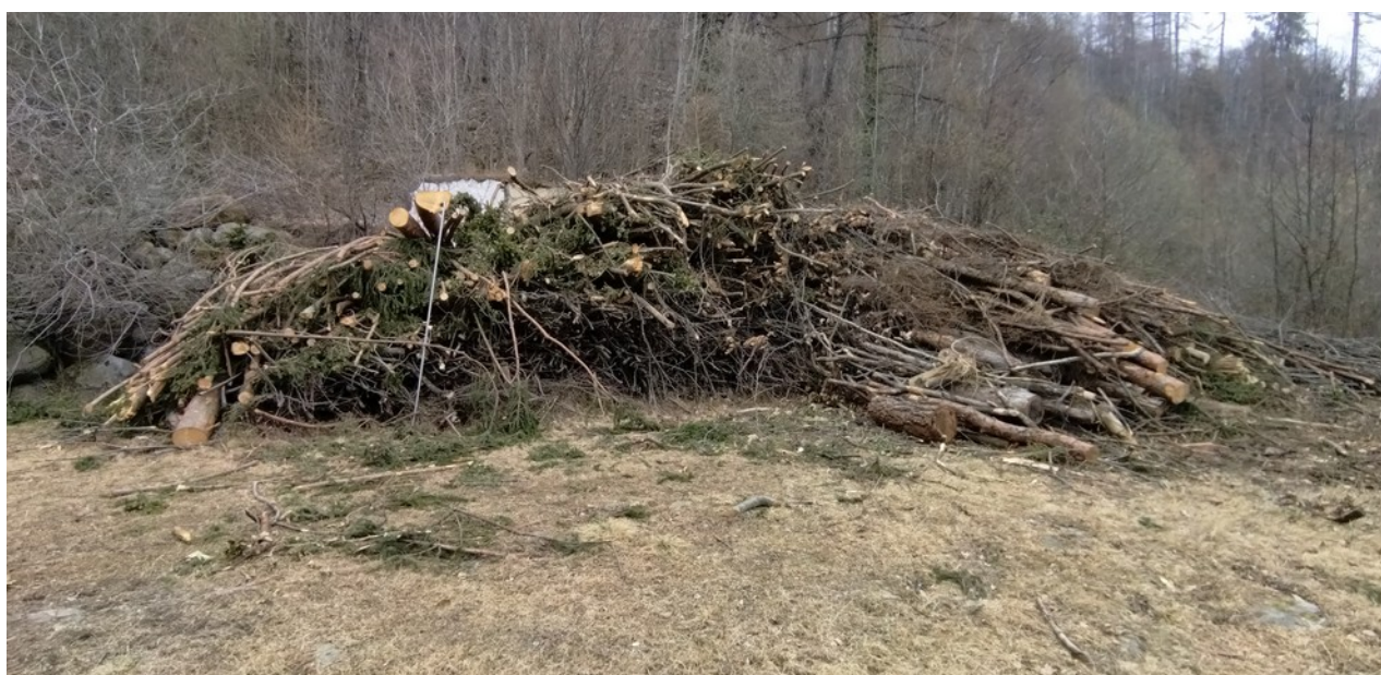
Lotto 14 – Ramaglia e cimali da triturazione – l'asta misura 3 m