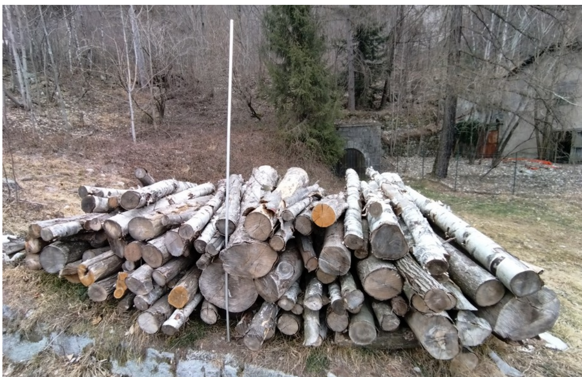
Lotto 12– Latifoglie da ardere (catasta A2 - bordo strada) – l'asta misura 3 m