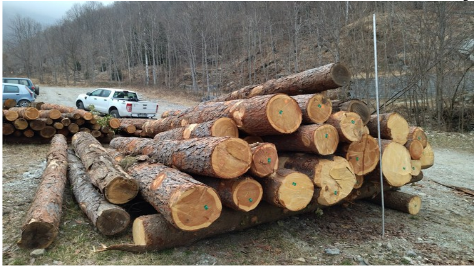
Lotto 9 – Larice e abete rosso da imballaggio – l'asta misura 3 m