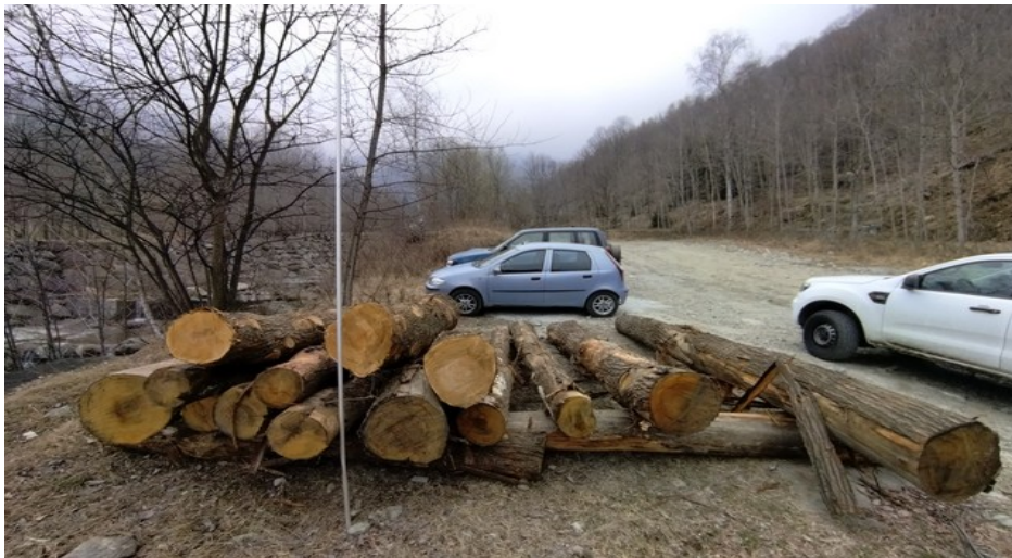
Lotto 10 – Castagno e larice da paleria (castagno)– l'asta misura 3 m