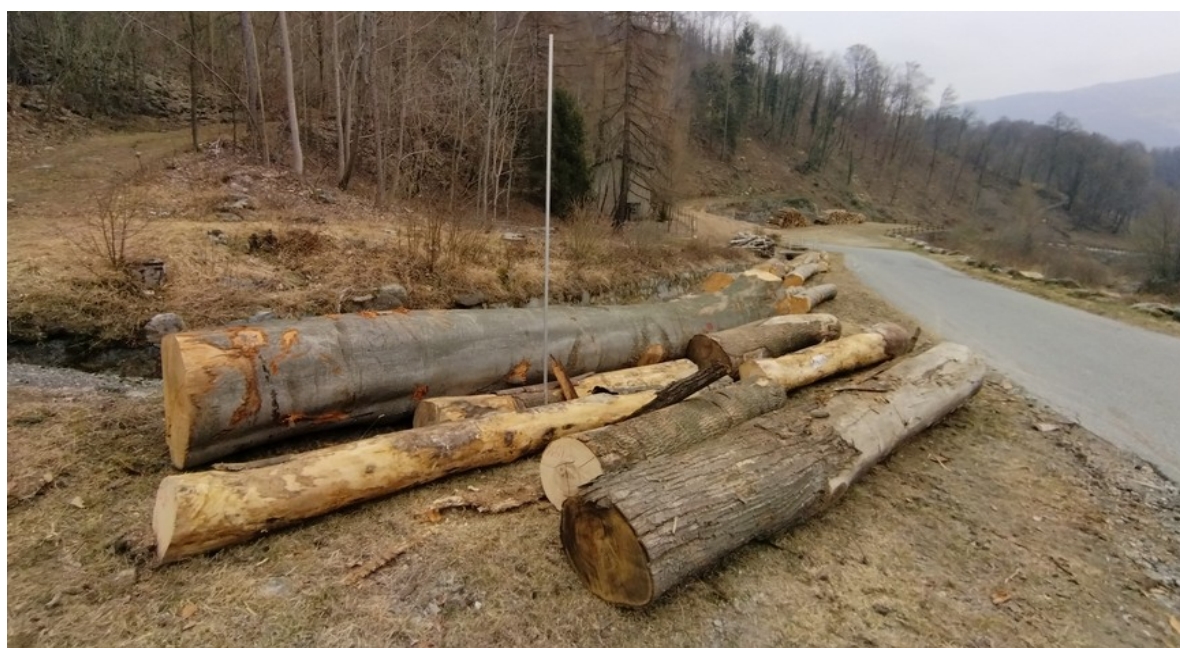
Lotto 8 – Latifoglie da opera – l'asta misura 3 m