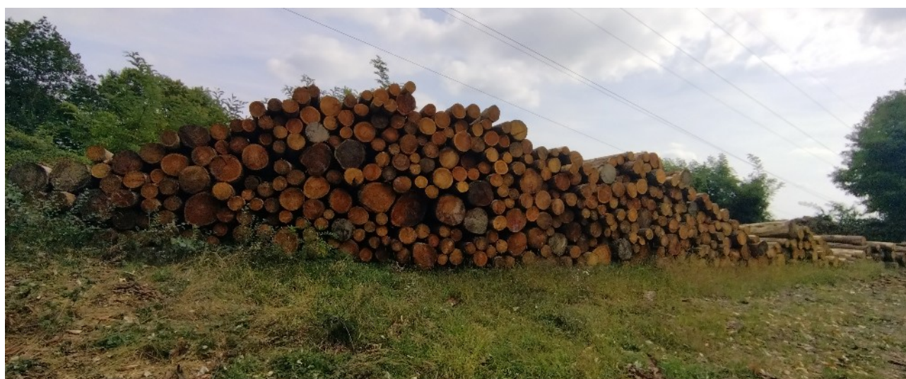
Lotto 1– Larice da opera