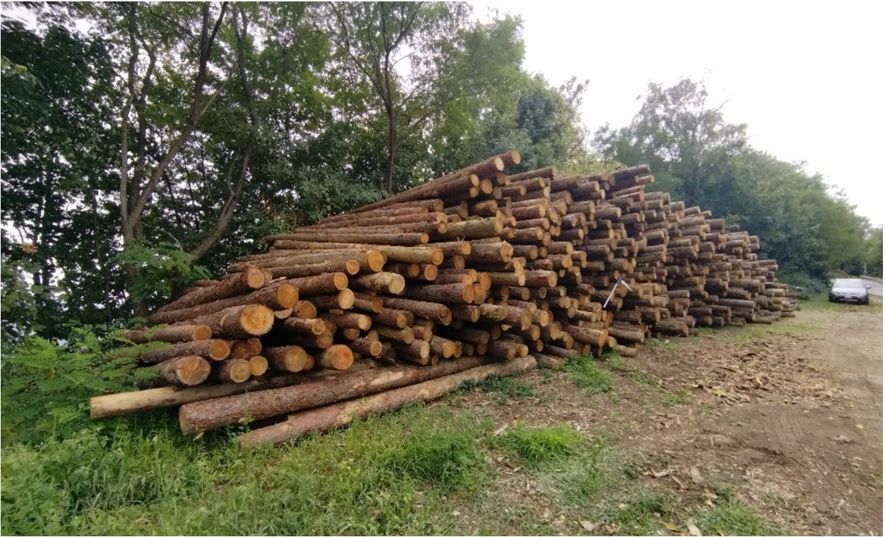
Lotto 2 – Larice da paleria