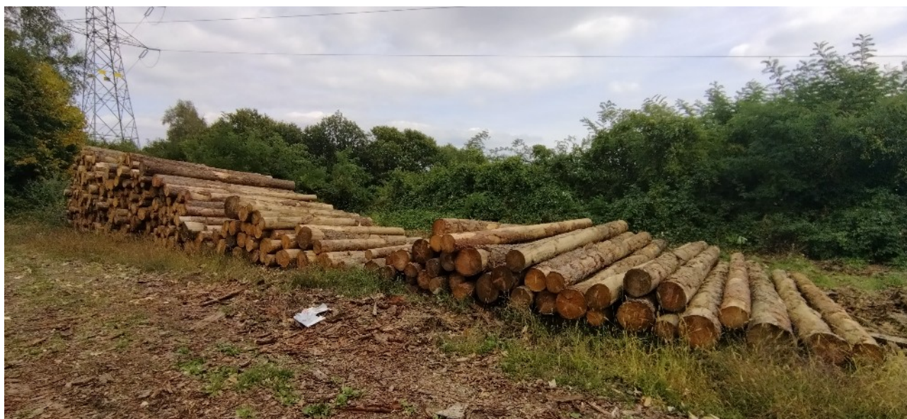
Lotto 1– Larice da opera