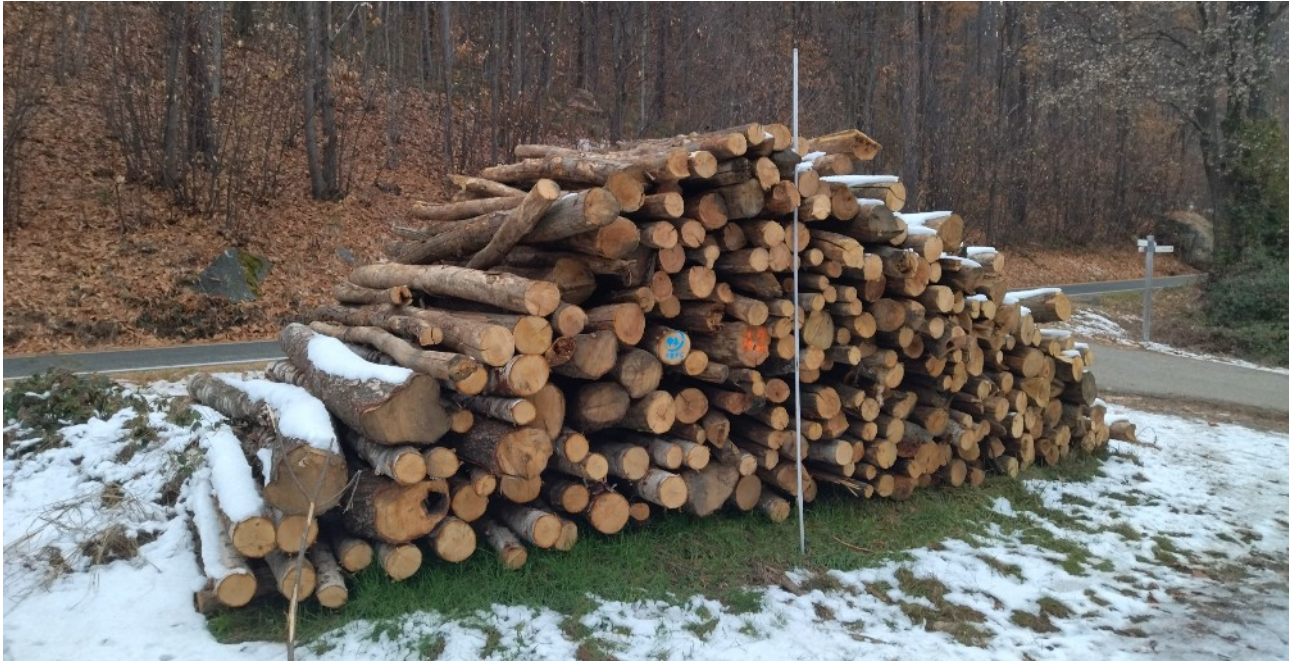
Lotto 10 – Legna da ardere (catasta A2)