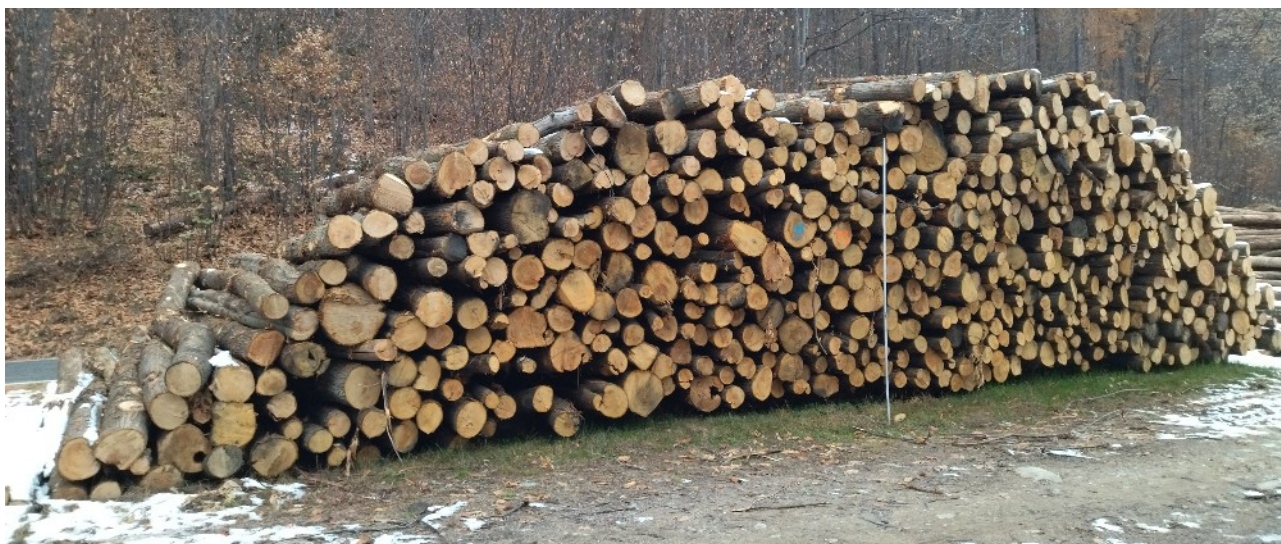
Lotto 8– Castagno da tannino (catasta T1)