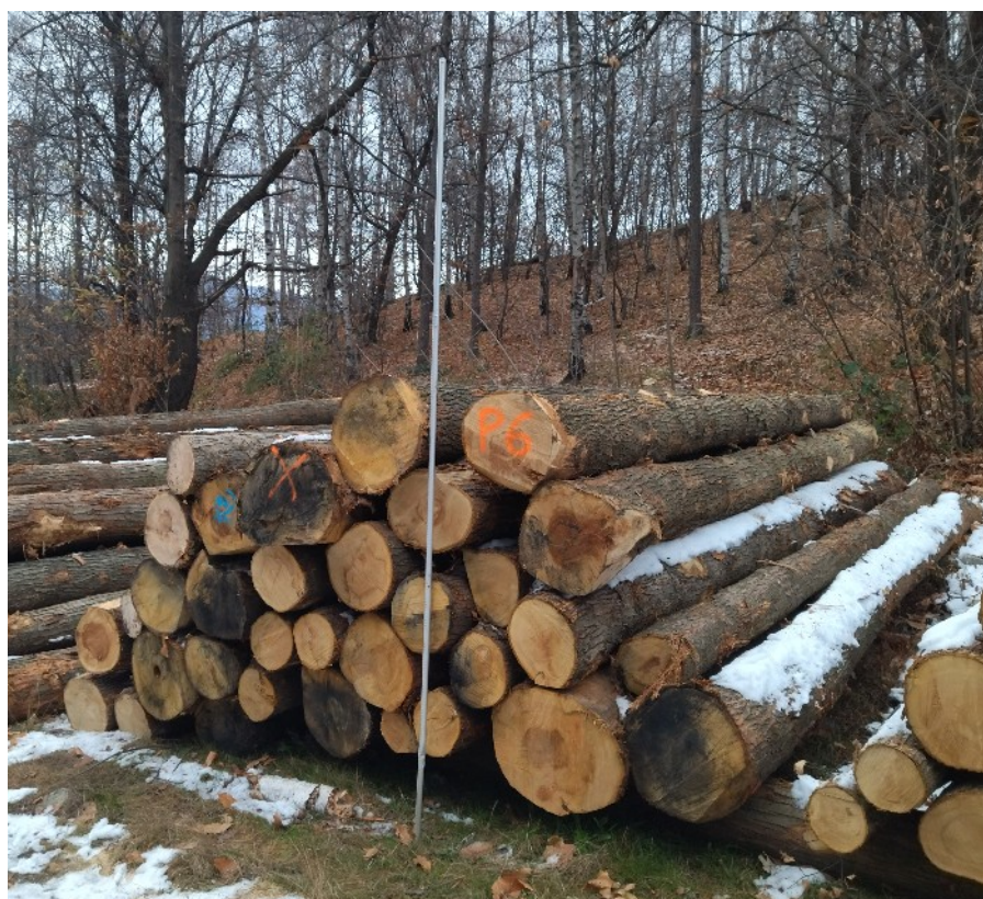
Lotto 7 – Castagno da paleria – pali da 6 m (catasta P6)