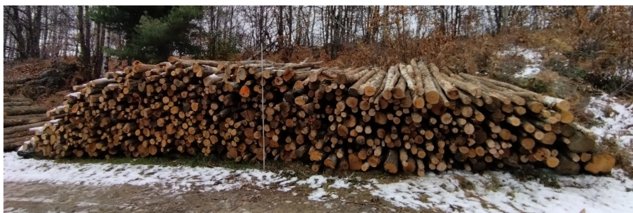
Lotto 9 – Legna da ardere (catasta A1)