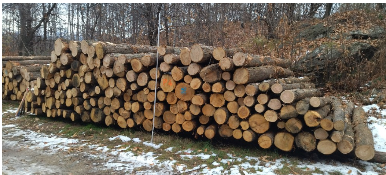
Lotto 7 – Castagno da paleria – pali da 4 m (catasta P4)