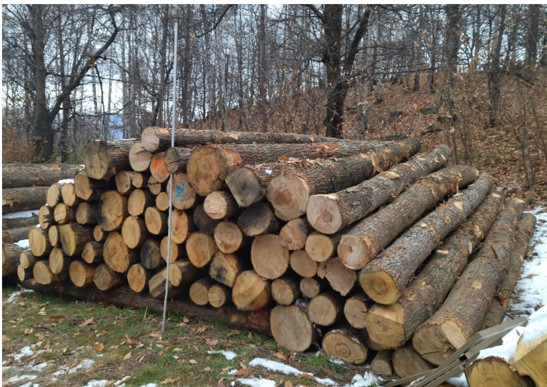
Lotto 7 – Castagno da paleria – pali da 5 m (catasta P5)