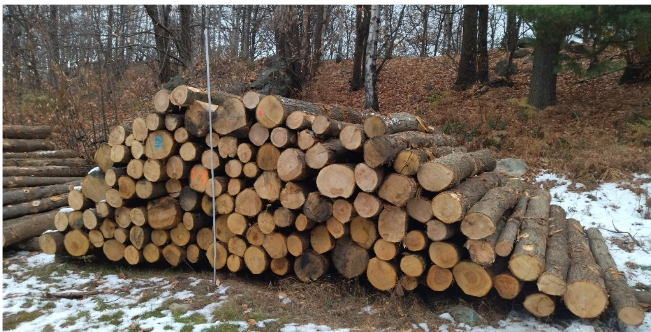
Lotto 7 – Castagno da paleria – pali da 3 m (catasta P3)

N.B. L'asta ripresa nelle fotografie misura 3 m di lunghezza