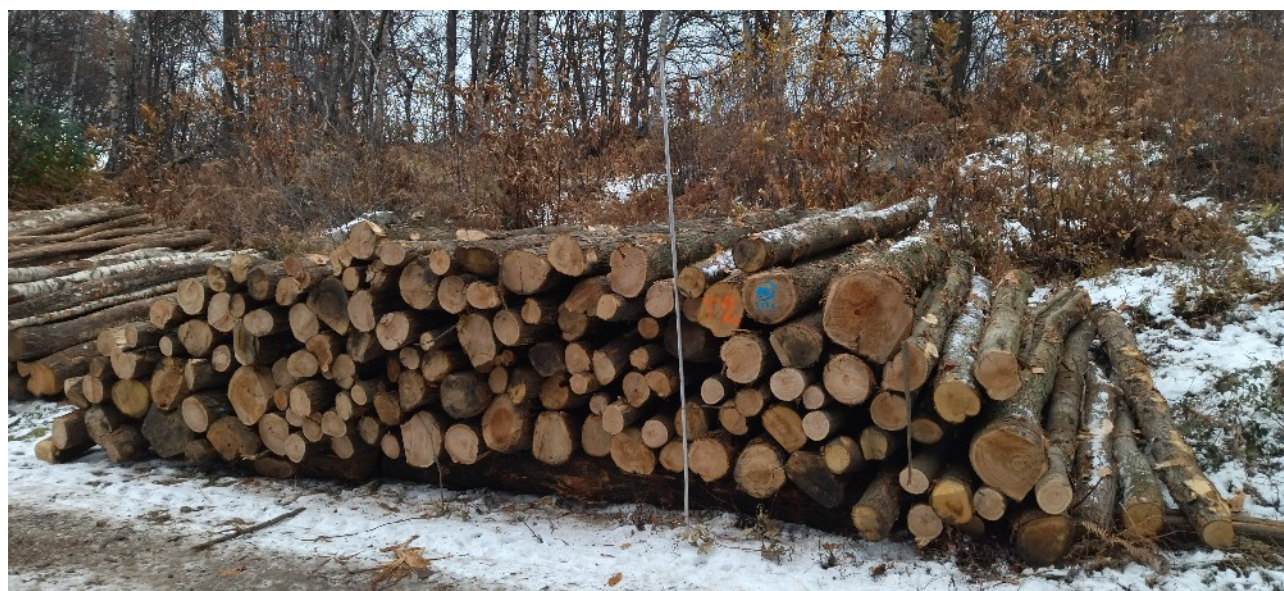
Lotto 8– Castagno da tannino (catasta T2)